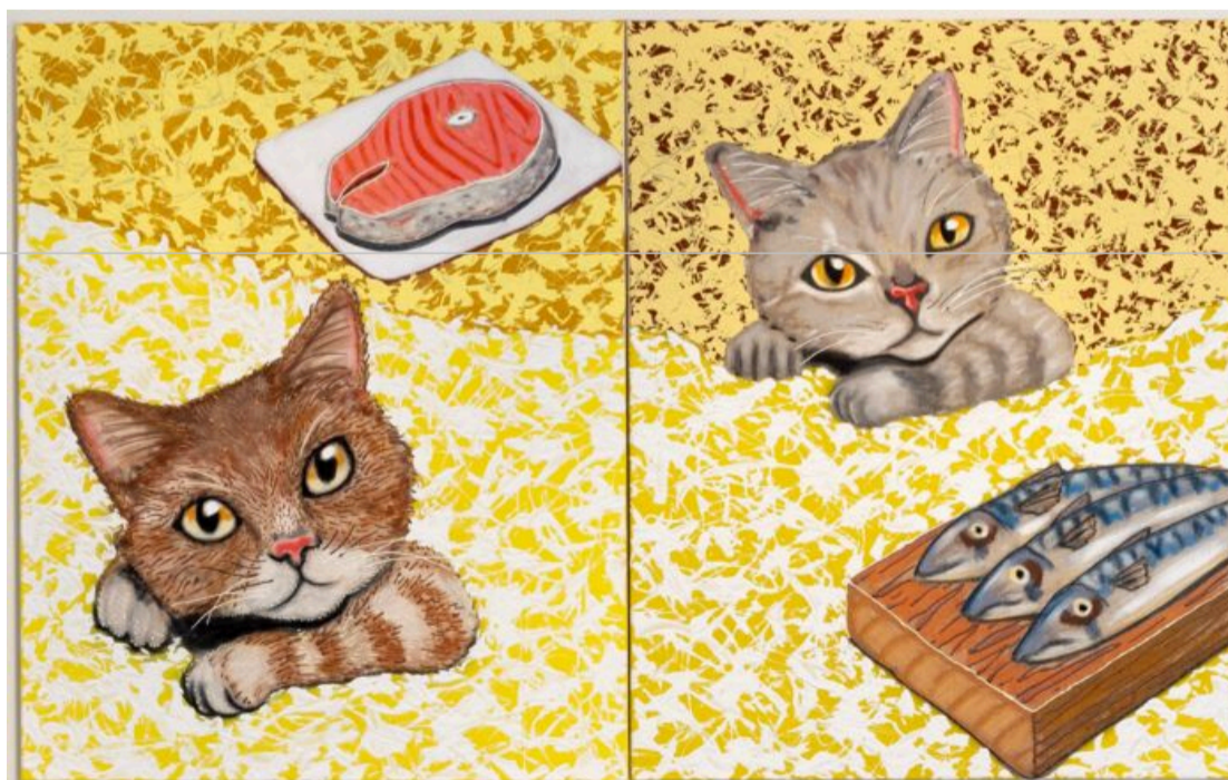
Går man tæt på kattedejerne, ser man, at pels og knurhår ligger som en slags glasur oven på maleriet, meget lig en pyntet kage.

Stilen er sjældent konsistent og har været det, siden han tog afgang fra kunstakademiet i København for snart et årti siden. Og til forskel fra en regressiv tendens blandt yngre danske malere til at relancere fortidens kanoniserede stilarter (symbolisme, surrealisme, ekspressionisme, sågar barok) er Andersens maleriske projekt ret meget hans eget show. Det er ægte samtidsmaleri, som forholder sig aktivt til den altdominerende billedstyrede tid, vi lever i.