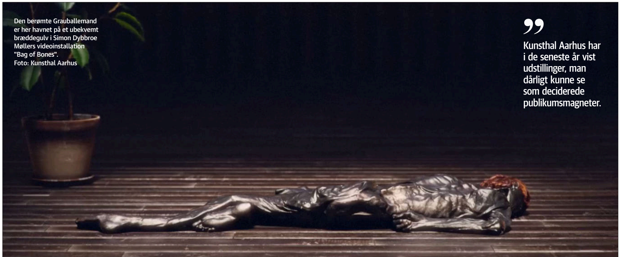
Den berømte Grauballemand er her havnet på et ubekvent bræddegulv i Simon Dybbroe Møllers videoinstallation "Bag of Bones".

” Kunsthal Aarhus har i de seneste år vist udstillinger, man dårligt kunne se som deciderede publikumsmagneter.