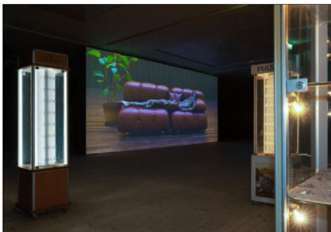
Med lidt god vilje kan man se bindingen mellem Grauballemanden og et antal støvede montrer, hvor ure tidligere har været udstillet.

farvefølelse, og af samme årsag går det ikke helt galt i mødet mellem farverne og de dirrende, konkretistiske strukturer på billedplanerne.